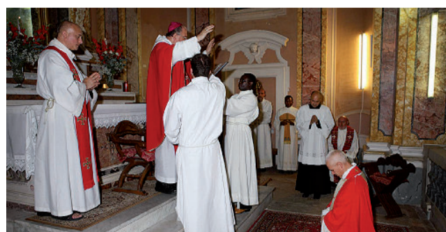
Civita Castellana, voti perpetui dell'eremita