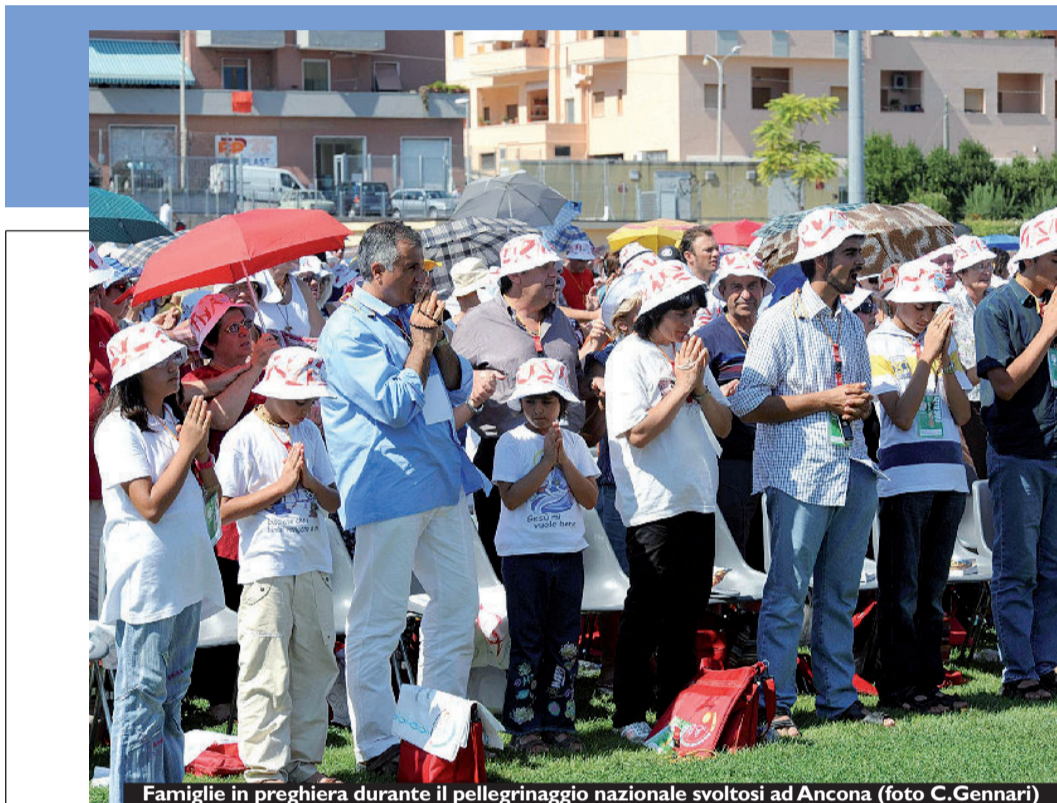
Famiglie in preghiera durante il pellegrinaggio nazionale svoltosi ad Ancona