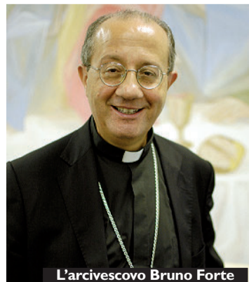
L'arcivescovo Bruno Forte

«Il dialogo come stile di vita ecclesiale e l'evangelizzazione» è il tema del Convegno diocesano che oggi e domani chiama l'arcidiocesi abruzzese di Chieti-Vasto - come tradizione - a Fara San Martino, nello scenario del Parco nazionale della Maelia, per vivere insieme l'apertura del nuovo anno pastorale. I lavori (ospitati presso l'Hotel del Camerlengo) prendono il via alle 15,30 di oggi con un intervento introduttivo dell'arcivescovo di Chieti-Vasto, Bruno Forte, a partire dalle indicazioni del Sinodo diocesano «Una Chiesa pellegrina sulla via della bellezza». Facendo riferimento al documento sinodale, il presule, nel presentare i lavori del convegno, ha esor-